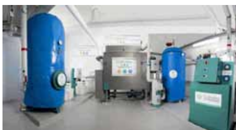
La pompe à chaleur

« Le système proposé par la société BioFluides nous a intéressé car il pouvait s'intégrer dans le bâtiment sans toucher aux canalisations souterraines, ce qui permet de maîtriser l'investissement. Techniquement, cette solution était donc parfaitement adaptée aux contraintes de notre résidence de Courcouronnes. Nous avons par ailleurs été très heureux de participer à l'expérimentation de cette solution car c'est en multipliant les efforts de recherche et développement, et en testant dans les conditions réelles les innovations, que l'on trouvera les meilleures solutions pour optimiser durablement l'efficacité énergétique des bâtiments ».